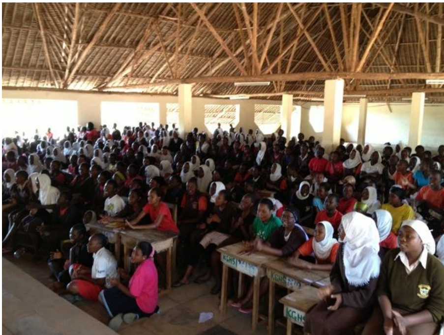
De meisjes van het internaat

VDT heeft als doel het structureel faciliteren en ondersteunen van projecten die efficiënt bouwen aan de toekomst van Kenia. Omdat kinderen de toekomst zijn, is een groot deel van de activiteiten van het VDT gericht op de kinderen in Kenia. In nauwe samenwerking tussen stichting RoFa Foundation en VDT, geadviseerd en ondersteund door AAWS, betrachten we de meisjes op korte termijn te voorzien van dagelijks schoon drinkwater.