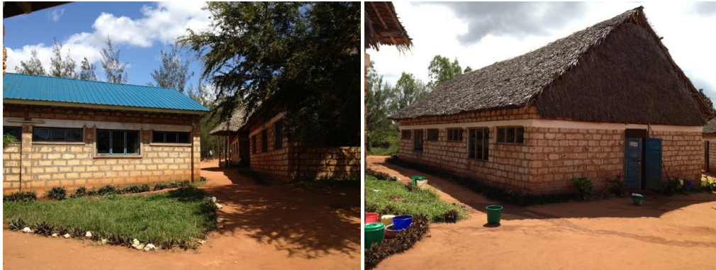
Enkele gebouwen van het internaat. Het dak van golfplaat is uitermate geschikt voor het opvangen van regenwater.

De RoFa Foundation wil het internaat ondersteunen met het voorzien van voldoende schoon drinkwater en een rendabele groentetuin. Dit willen we doen door het hemelwater op te vangen en te bewaren in twee watertanks van elk 60 m 3 . Door het plaatsen van een UV-filter van AAWS kan dit water veilig gedronken worden, ook in de droge periodes. Een teveel aan hemelwater wordt opgevangen in de nu nog vervallen irrigatievijver. Deze zal dan ook gerenoveerd moeten worden.